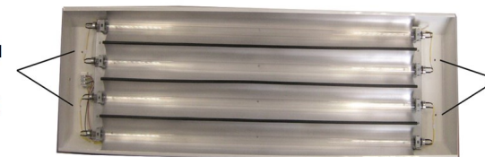
Orificii pentru montarea dispozitivului