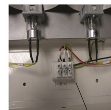
Terminal borna electrica